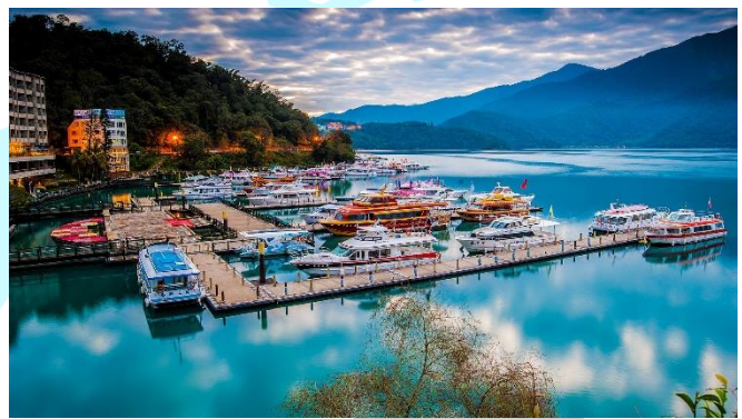
Nhật Nguyệt Đàm – Nam Đầu

Trưa: Đoàn dùng cơm trưa, sau đó xe đưa đoàn tham quan: