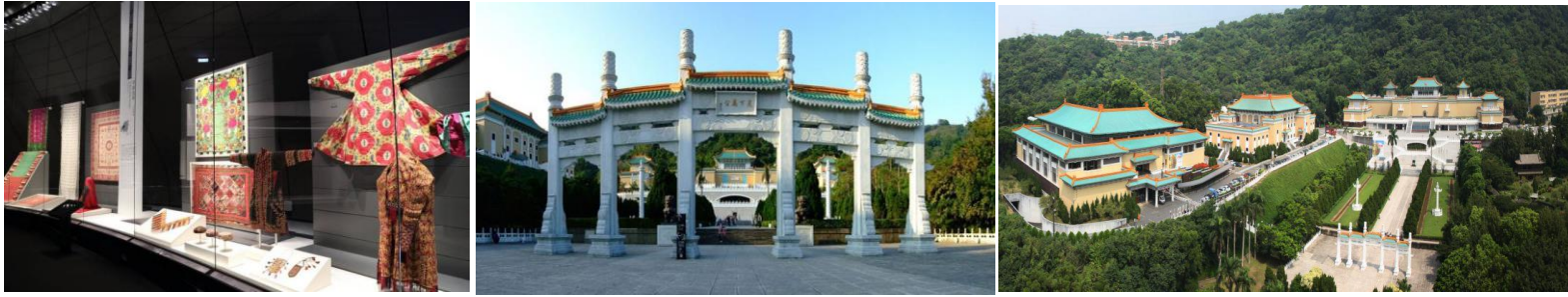
Bảo tàng Cổ Cung - Bảo tàng Cổ cung Quốc gia Đài Bắc

👉 Đoàn tiếp tục tham quan ngoại cảnh “ Bảo tàng Cổ Cung ”.