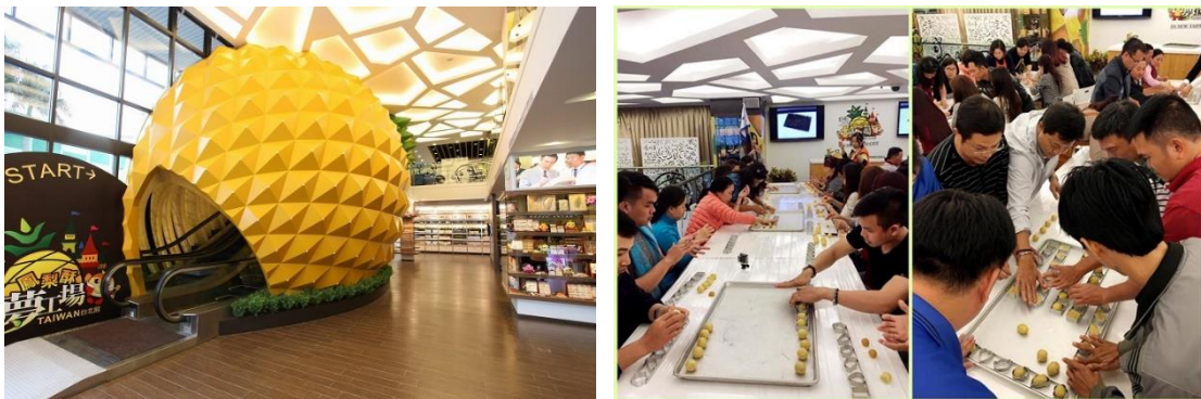
Lâu đài Dứa Vàng và Học làm bánh dứa Vigor Kobo

👉 Đoàn tham quan “ Lâu đài Dứa Vàng ” – là thương hiệu nổi tiếng chuyên sản xuất các loại bánh nhân dứa ở Đài Loan. Những chiếc bánh có vị chua tự nhiên của trái dứa, vị dịu ngọt của mạch nha, mùi thơm ngậy của bơ sữa. Tất cả hòa quyện vào nhau với lớp bánh mềm và xốp bên ngoài tạo nên những chiếc bánh dứa vô cùng tinh tế mang đậm phong cách ẩm thực xứ Đài, và đó thực sự là món ăn đáng để mọi người thưởng thức. Tại đây Quý khách được tham gia lớp học làm bánh và có thể tìm hiểu thêm về cách làm bánh này.