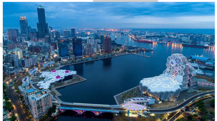
Trung Tâm Nhạc Pop Cao Hùng (Love River Bay)

Tối: Đoàn về khách sạn nhận phòng và nghỉ ngơi. Hoặc tự do khám phá thành phố Cao Hùng về đêm.