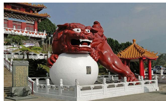
Văn Võ Miếu – Đài Trung