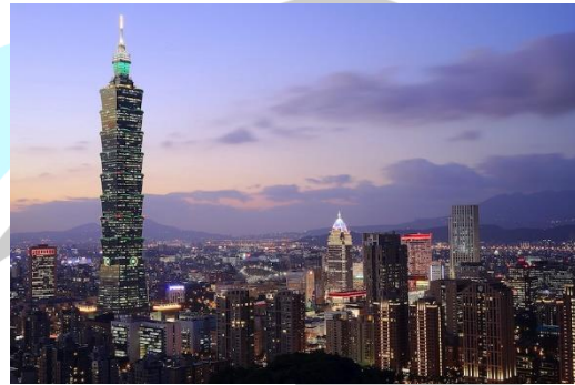
Tòa Tháp Tapei 101 – Đài Bắc