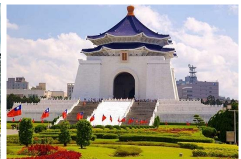
Quảng trường và nhà tưởng niệm “Tưởng Giới Thạch”