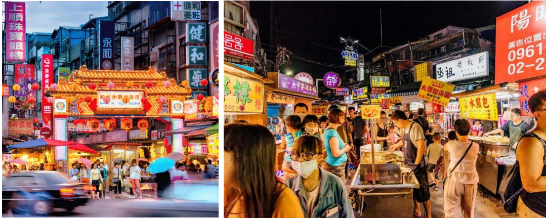
Chợ Đêm Tây Môn Đình – Đài Bắc

Tối: Xe đưa đoàn đi dùng cơm tối, Quý khách dùng bữa tối, Đoàn về khách sạn Đài Bắc nhận phòng nghỉ ngơi.